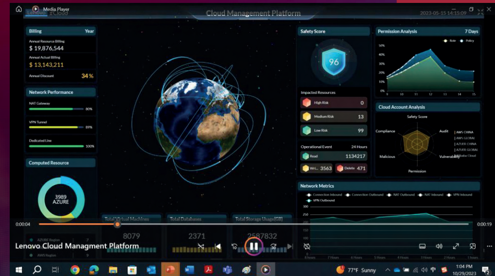
Plataforma de Gerenciamento de Nuvem Híbrida da Lenovo

Diretor de P&D de Produtos Nativos de Nuvem Lenovo