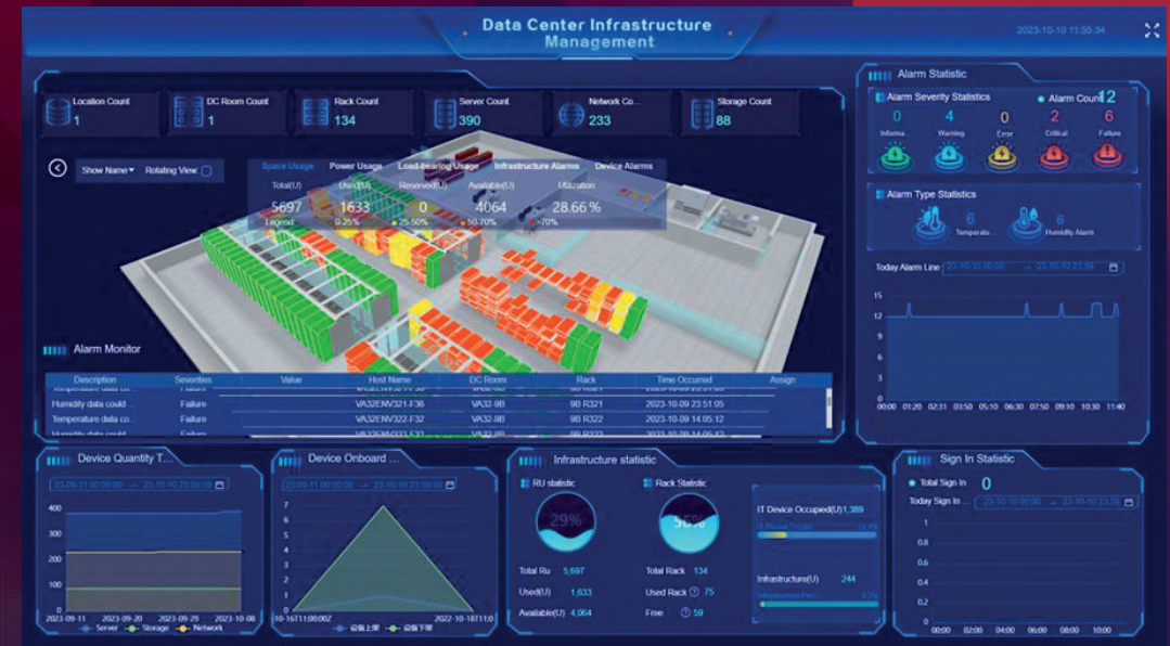
Plataforma de Gestão de Nuvem Híbrida da Lenovo